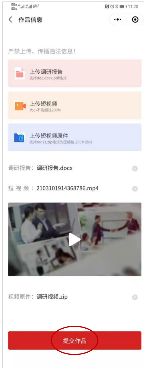
上传成功后效果图